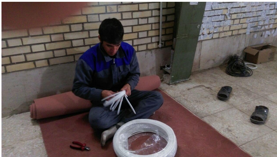
قبل از اصلاح