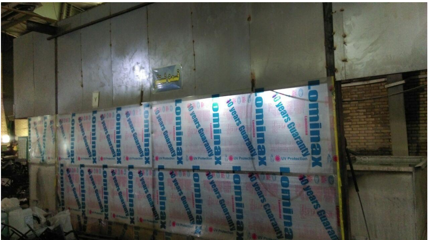
این دو عکس بالا مربوط به چربیگیری است که ما این قسمت را کامل محصور کردیم