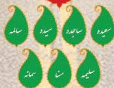
هفت سین فاطمی